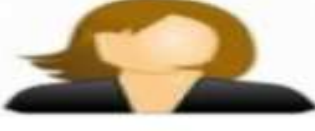
Elif AY Matematik